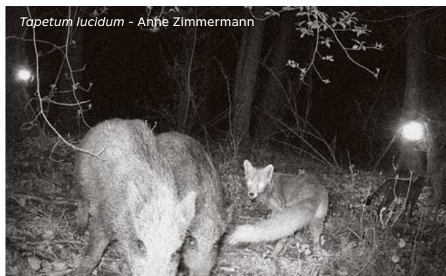
Tapetum lucidum - Anne Zimmermann

Elle collabore pour l'Espace Gantner avec les Presses du Réel (Dijon) à l'édition d'ouvrage sur les arts numériques, avec un focus sur les femmes artistes.