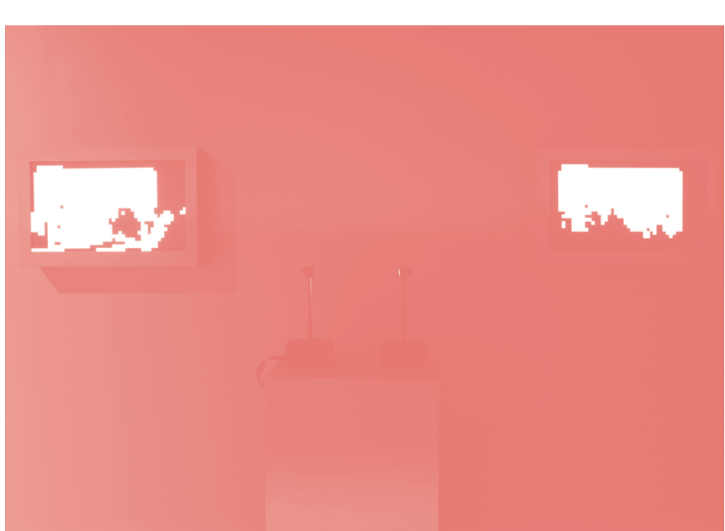
LIGHT-NET by Paula Vitola.

Rua Red, Dublin, Irlande Rua Red South Dublin Arts Centre est un centre de pratiques d'arts contemporains établi, reconnu et influant situé à Tallaght, Dublin, Irlande. Il comprend des ateliers d'artistes, des espaces d'incubation, 2 galeries d'exposition, un espace pour performances, d'un studio de répétition, d'une salle d'ateliers, de salles de musiques, d'un laboratoire d'ordinateurs MAC et d'un café.