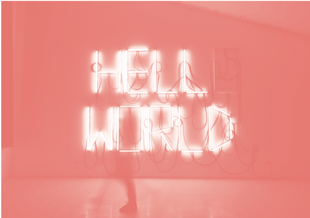
Hello World by Fabien Leastic

'Hello World' est une sculpture qui oscille entre un optimisme naïf et une poésie sombre. Activée par la présence du spectateur, cette œuvre expose les digressions de l'univers numérique. Elle nous amène à nous demander si l'évolution des technologies numériques est en fait bénéfique ou destructif dans nos vies. Quand l'œuvre s'active, elle épèle d'abord un message positif, puis le "o" disparaît, finissant par laisser un message considérablement plus dystopique.