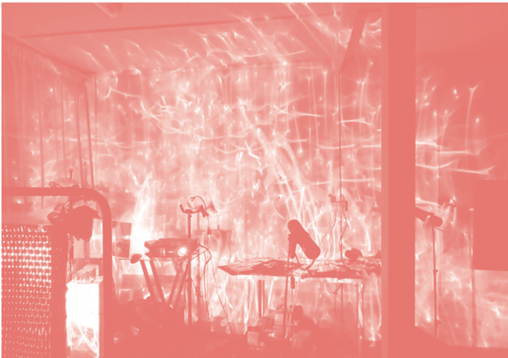
Mirror Affect by Helen McMahon.

Cette œuvre invite le spectateur à une expérience sensorielle qui désoriente. L'écran de projection ainsi reflété devenant une sorte d'interface sociale, qui capture l'action des spectateurs à l'intérieur de l'activité même de l'œuvre.